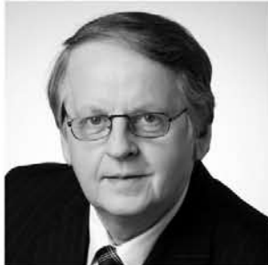
nr 673 ENN EESMAA

Riigikogu väliskomisjoni aseesimees, Keskerakonna aseesimees