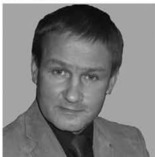
nr 682 JAAK AAB

Riigikogu liige, endine sotsiaalminister