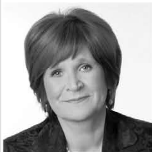
nr 674 KERSTI SARAPUU

Riigikogu väliskomisjoni aseesimees, Keskerakonna aseesimees