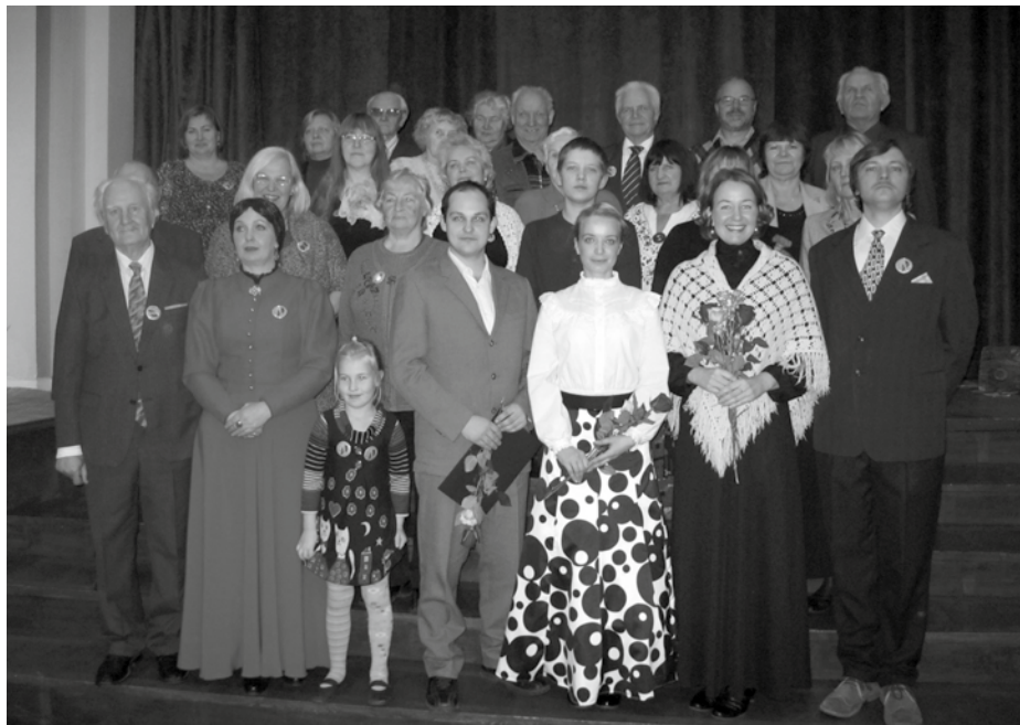
Kultuurimajja kogunesid Koeru näitemänguharrastajad läbi aegade.