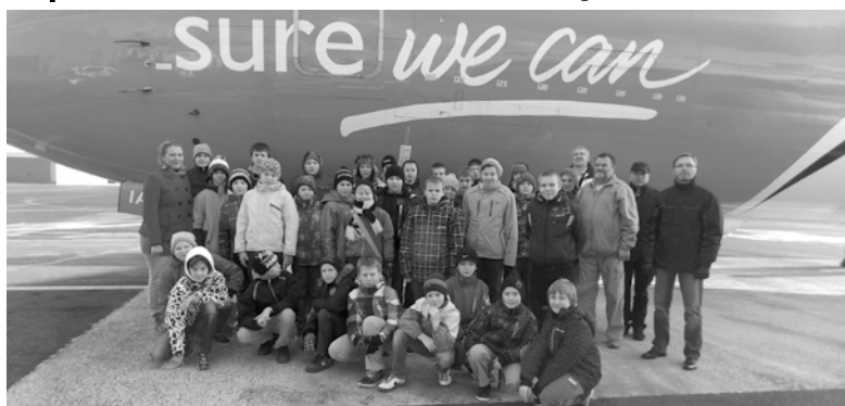
Kooliõpilased lennuki juures.