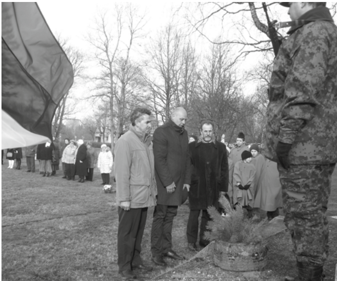
Vabariigi aastapäeval asetavad lillekorvi sangarite ausamba jalamile vallavanem, volikogu esimees ja aseesimees.

20. veebruaril tähistati Koeru kultuurimajas Eesti Vabariigi 96. ja Koeru valla 22. sünnipäeva, mida traditsiooniliselt koos peetakse.