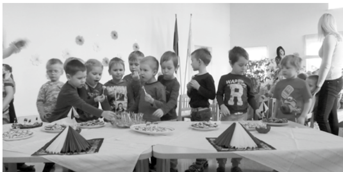
Vabariigi aastapäeva kontsert-aktus.