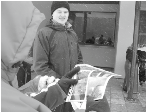
Hetk enne otsingule suundumist.